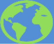
Схема направления граждан РК на лечение за рубеж за счет бюджетных средств